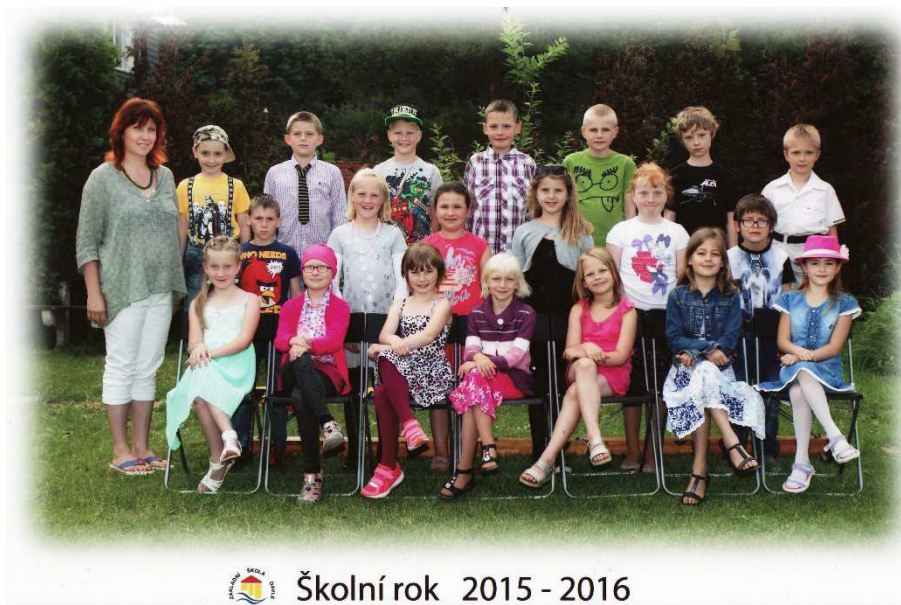
Školní rok 2015 - 2016