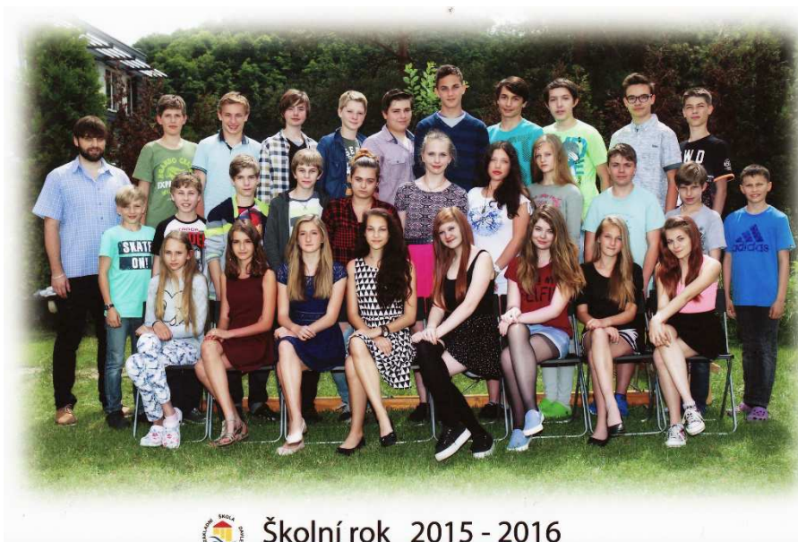
Školní rok 2015 - 2016